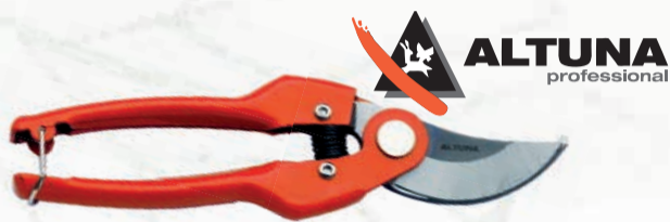
TIJERA 1 MANO J469 ALTUNA ADVANCED Mangos de acero estampado.

Ref. PG0193 · 15 cm | 9,92 € + IVA = 12,00 € | Ref. 6.1