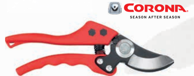
TIJERA PODAR CORONA

Ref. J465 | 13,97 € + IVA = 16,90 € | Ref. 6.22