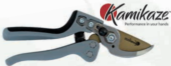
TIJERA PODAR 1 MANO KM-1M FORCE KAMIKAZE

Ref. BP4180 | 14,83 € + IVA = 17,95 € | Ref. 6.46