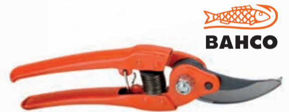
PODADERA 1 MANO PROFESIONAL BAHCO

Ref. T112 | 21,90 € + IVA = 26,50 € | Ref. 6.23