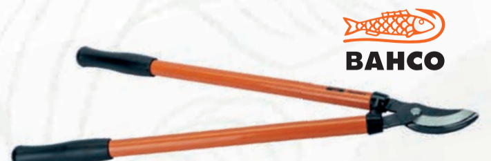
TIJERA PODAR 2 MANOS P140 BAHCO

Ref. 11.510.001 | 49,55 € + IVA = 59,95 € | Ref. 6.181