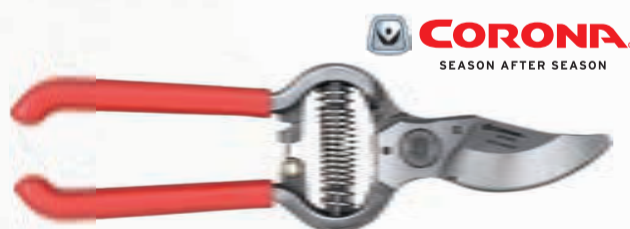
TIJERA 1 MANO AMERICANA CLASSIC CUT® CORONA

Ref. BP4250 | 25,58 € + IVA = 30,95 € | Ref. 6.43