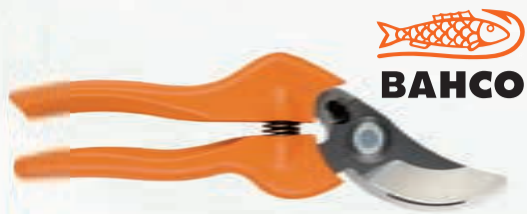
TIJERA PODAR 1 MANO BAHCO 20 mm.

Ref. PG-12-F | 8,18 € + IVA = 9,90 € | Ref. 6.154