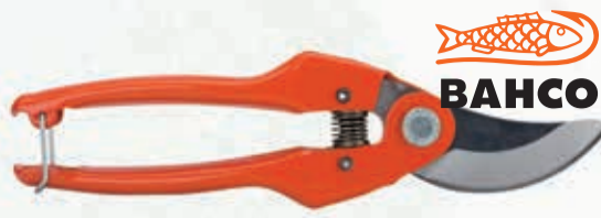
TIJERA PODAR 1 MANO TRADICIONAL BAHCO

Ref. PG-12-F | 8,18 € + IVA = 9,90 € | Ref. 6.154