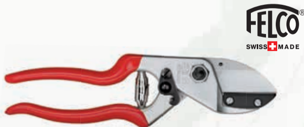
TIJERA PODAR FELCO 31

Ref. 3505-23 | 32,19 € + IVA = 38,95 € | Ref. 6.39