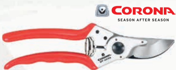
TIJERA PODAR 1 MANO CORONA

Ref. P110-23-F · 23 cm | 24,75 € + IVA = 29,95 € | Ref. 6.156