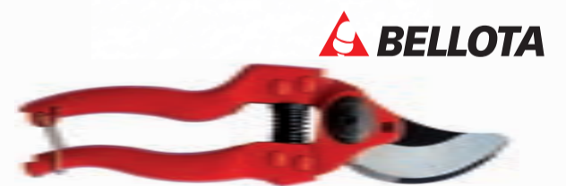
TIJERA PROLINE 1 MANO UNIVERSAL BELLOTA

Ref. BP3180D | 28,84 € + IVA = 34,90 € | Ref. 6.70