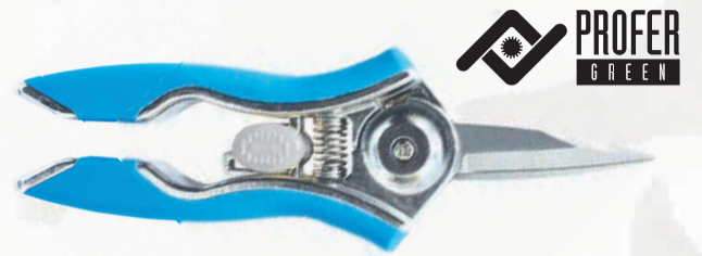
TIJERA PODAR 1 MANO PROFER GREEN

Ref. P126-22-F · 22 cm | 13,97 € + IVA = 16,90 € | Ref. 6.158