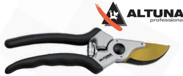
TIJERA PODAR 1 MANO ALTUNA TITANIUM

Ref. 10930 | 20,25 € + IVA = 24,50 € | Ref. 6.149